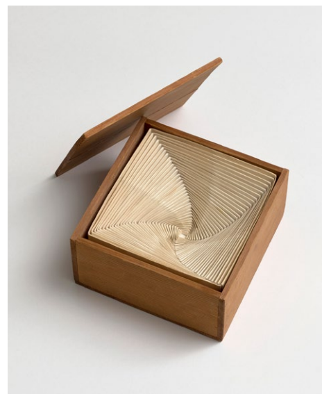
Mieko Shiomi, Endless Box , 1964, SAMMLUNG/ARCHIV ANDERSCH im Museum Abteiberg, © Mieko Shiomi

Der Museumsverein Abteiberg hat im Jahr 2024 eine Edition von Takako Saito mit gestempelten Gesichtern als Jahresgabe herausgegeben. Aus der Serie Faces sind derzeit noch vier Exemplare erhältlich. (MS)