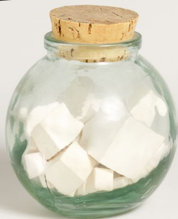
Takako Saito, Musicbottle , 1984, SAMMLUNG/ARCHIV ANDERSCH im Museum Abteiberg, © VG Bild-Kunst, Bonn 2026, Foto: Ludwig Kuffer