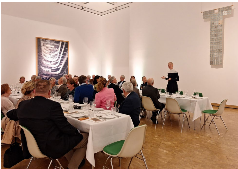
Ankauftreffen im Rahmen des Jubiläums 2024

Ein besonderes Highlight des Förderkreisjahres ist das wieder bald stattfindende Ankauf-Dinner im ersten Quartal. In persönlicher und anregender Atmosphäre kommen die Mitglieder zu einem gemeinsamen Abend zusammen, um über mögliche Neuerwerbungen zu beraten und zu entscheiden. Die Museumsleitung stellt vorab ausgewählte Werke vor, erläutert Hintergründe und kuratorische Überlegungen. Sofern möglich, sind auch die Künstler:innen selbst anwesend, geben Einblicke in ihre Arbeit und