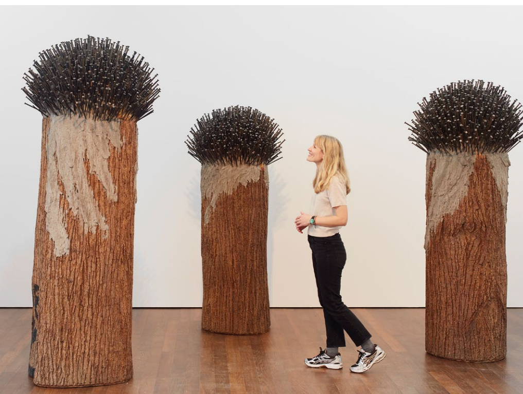
Günther Uecker, Die Verletzlichkeit der Welt , Ausstellungsansicht Arp Museum

2025 ist Günther Uecker mit 95 Jahren verstorben. Die Ausstellung im Arp Museum Bahnhof Rolandseck ist die erste nach seinem Tod und dabei die letzte, an der er noch selbst mitgewirkt hat. Wie in den Medien ausführlich berichtet, würdigt sie den international bekannten Künstler, der mit seinen ikonischen Nagelbildern und -reliefs Kunstgeschichte schrieb und als prägende Persönlichkeit der Künstlergruppe ZERO die Kunst der Nachkriegszeit revolutionierte. ZERO feierte im November 1964 im historischen Festsaal ein rauschendes Abschiedsfest und löste sich hernach auf. Zugleich markiert dies die Gründungsgeschichte des heutigen Museums, das 2007 eröffnet wurde.