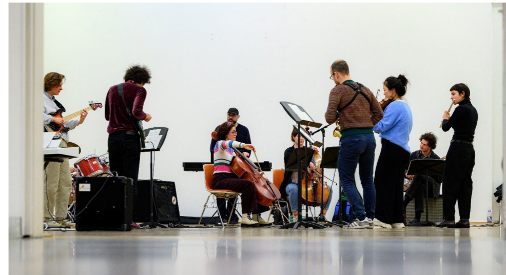
KUNSTHALLE FOR MUSIC, Act II, Workshop, Museum Abteiberg, Mönchengladbach, 2024

5. Mai – 23. Juni 2024, Eröffnung: Sonntag, 5. Mai, 12.00 Uhr