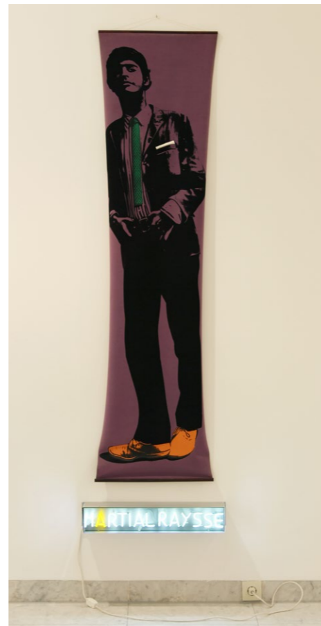
Martial Raysse, Bel été concentré , 1967, Museum Abteiberg Mönchengladbach © VG Bild-Kunst, Bonn 2024, Foto: Museum Abteiberg

ATELIER VOR ORT Werkstatt Expressionismus Atelier Strichstärke im Museum Abteiberg 10. März – 21. April 2024 Eröffnung: Sonntag, 10. März, 12.00 Uhr