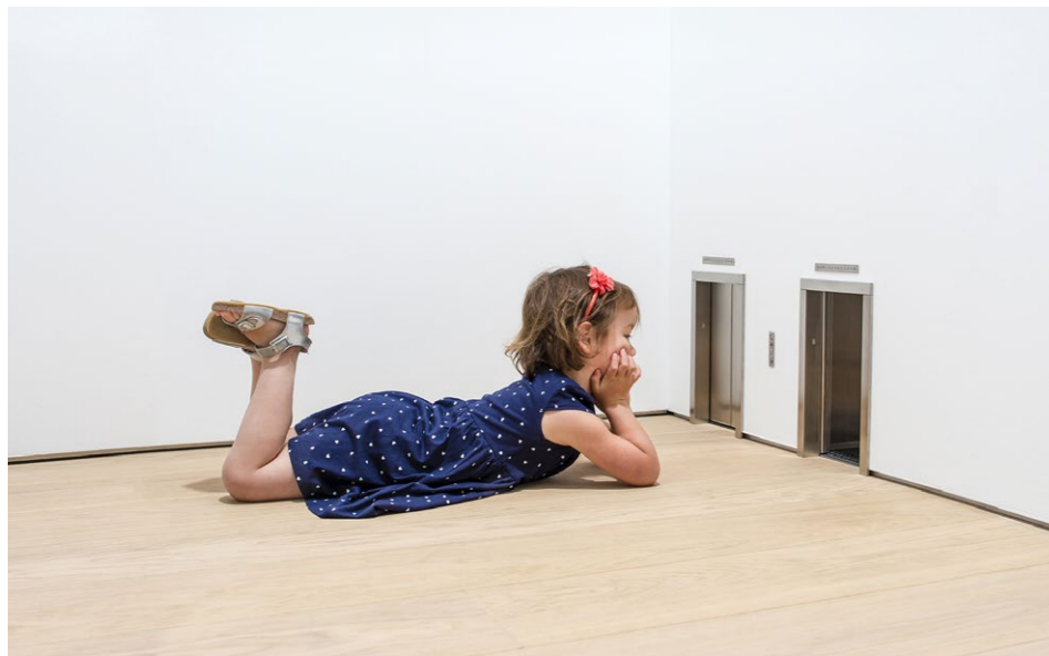
Maurizio Cattelan, Miniaturaufzüge , 2016, Museum Voorlinden

Es ist eine der bedeutendsten privaten Kunstsammlungen der Niederlande, die der Gründer des Chemie- und Nahrungsmittelkonzerns Caldic, Joop van Caldenborgh, in den letzten Jahrzehnten zusammengetragen hat. Seiner Caldic Collectie hat er 2016 im Süden der ländlichen Gemeinde Wassenaar, gleich hinter der Stadtgrenze von Den Haag, auf dem Landgut Voorlinden mit seiner prachtvollen Villa von 1912 eine beeindruckende Spielstätte bauen lassen: Ein museum in het groen , ein Museum im Grünen, dessen Garten vom niederländischen Landschaftsgärtner Piet Oudolf gestaltet worden ist. In die 40 ha große Parklandschaft des Landguts ist der Ausstellungsneubau des Museums Voorlinden nach Entwürfen Dirk Jan Postels vom Architekturbüro Kraaijvanger eingefügt. Vorbilder waren Mies van der Rohe's Neue Nationalgalerie sowie das von Renzo Piano entworfene Gebäude der Foundation Beyeler in Riehen. Ein einstöckiger Pavillon von rund 120 x 50 Meter Ausdehnung aus Naturstein und großen Glasfronten bildet den Raum für die Sammlung. Dazu gehören unter anderem Arbeiten von Richard Serra, Leandro Erlich, Maurizio Cattelan und Ron Mueck. Teil des Museums ist außerdem ein Skyspace von James Turrell. Aktuell wird eine Einzelausstellung von Alicja Kwade (*1979) gezeigt, deren Werken wir jüngst im Duisburger Lehmbruck Museum begegnet sind.