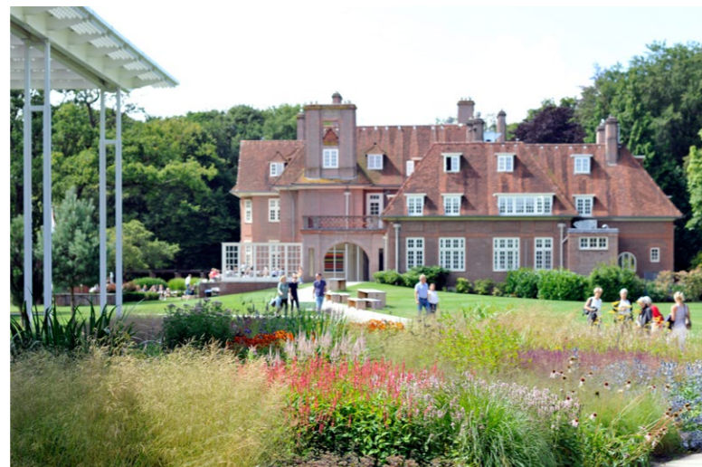
Museum Voorlinden, Blick auf die Villa von 1912 und den Garten von Piet Oudolf

Anmeldung ab sofort im Sekretariat des Museumsvereins unter den bekannten Nummern (siehe Impressum). Bitte überweisen Sie den Kostenbeitrag sofort nach erfolgter Anmeldung auf eines der Konten des Museumsvereins. (CK)