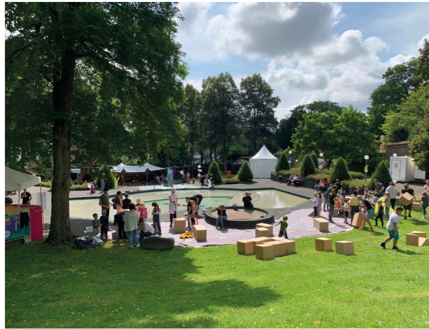
Pop Paradiso Festival 2021

an. Die Mönchengladbacher:innen können aus dem Buch Bilder ohne Geld von Jens Ullrich Motive kopieren, scannen, drucken und vielfältigen. Es steht eine Anleitung und eine Tapezierwerkstatt im Museum bereit, um sie als Großformate nach Hause oder an Orte eigener Wahl zu bringen. Museum und Künstler suchen bereits vor POP Paradiso interessierte Menschen, die ab dem 4. Juni Lust auf das Experiment haben und Bilder ohne Geld bei sich tapezieren möchten. Bei Interesse bitte ab sofort im Museum Abteiberg melden. Es kostet nichts, ein großes Bild von Jens Ullrich an einen eigenen, frei bestimmten Ort zu bringen, ohne es wieder zurückgeben zu müssen. Kontakt: mail@museum-abteiberg.de , Betreff: Bilder ohne Geld.