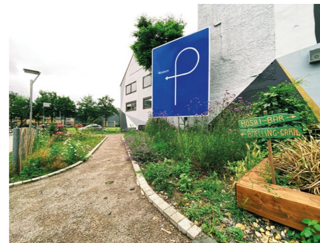
Boelling-Garten, Thomas Rentmeister, Museum, 2002

Geplant vom Museum Abteiberg ist der Bücherschrank im Boelling-Garten seit dem 24. Mai realisiert in Kooperation mit dem Museumsverein Abteiberg e.V., der Unterstützung des Quartiersmanagements Gladbach & Westend und des Fonds „Aktive Mitwirkung der Beteiligten“ aus Mitteln der Sozialen Stadt Gladbach & Westend. (HR)