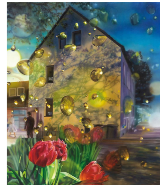
Karin Kneffel, Ohne Titel , 2021, Öl auf Leinwand, Privatsammlung © VG Bild-Kunst, Bonn 2022, Foto Ivo Faber, Düsseldorf

Anmeldung ab sofort im Sekretariat des Museumsvereins unter den bekannten Nummern (siehe Impressum). Bitte überweisen Sie den Kostenbeitrag nach erfolgter Anmeldung auf eines der Konten des Museumsvereins