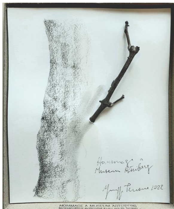
Giuseppe Penone, Hommage à Museum Abteiberg , 2022, Bleistift, Kohle und Bronze auf weißem Karton, 32,5 x 27,5 cm

So haben wir unter dem Titel Hommage à Museum Abteiberg all jene Künstler:innen angeschrieben, die über die Jahrzehnte hinweg in besonderer Verbindung zum Museum Abteiberg oder dem Museumsverein stehen, mit der Bitte, ihre Gedanken zum Antimuseum Ausdruck zu verleihen. Rund 130 leere Schachteln im Format 33,5 x 28 x 2,5 cm konnten wir verschicken, in der Hoffnung, möglichst viele von diesen bearbeitet und signiert sowie datiert zurück zu erhalten. Inzwischen sind bereits 20 Exponate bei uns eingetroffen, weitere 15 sind bislang in Aussicht gestellt. Wir freuen uns über diese zahlreichen unikatären Rücksendungen, die wir dann am 17. November als besondere Jubiläumsjahresgabe exklusiv unseren Mitgliedern anbieten. Bleiben Sie gespannt. Weitere Informationen folgen. (CK)