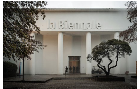
Biennale Gelände Giardini

Den mit ViadellArte, Kunst- und Kulturführungen GmbH, Bonn konzipierten Besuch der Biennale Venedig vom 29. September – 2. Oktober indessen können wir durchführen. Hier sind noch ein paar Plätze frei.